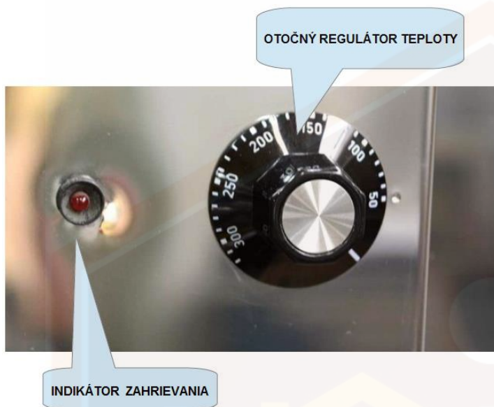
2.-es kép: Hőmérséklet szabályzó

Hőmérséklet szabályzó elfordításával beállíthatja a kívánt hőmérsékletet 0°C - 320°C-ig.